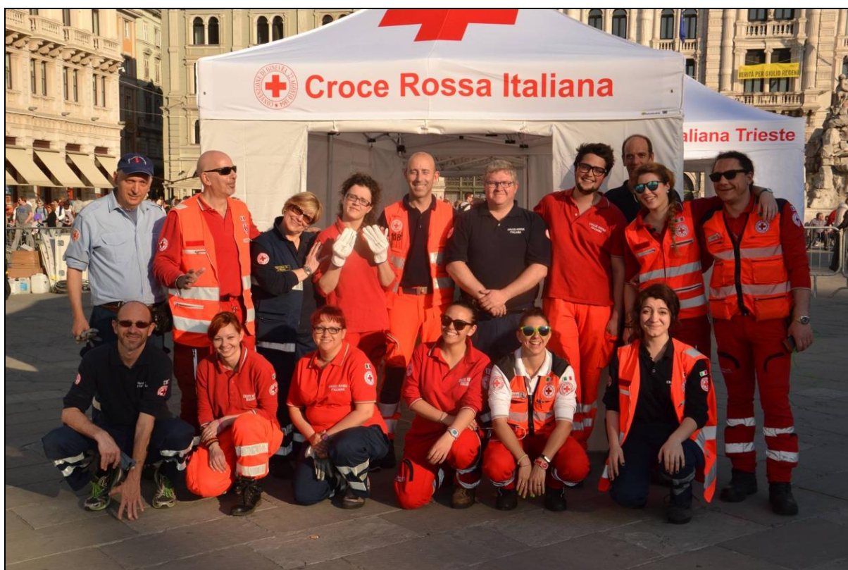
Volontari in servizio durante la Bavisela 2016

L’ampiezza e la durata delle raccolte di fondi sono variabili, giacché sono correlate a campagne nazionali oppure a occasioni di festa locali.