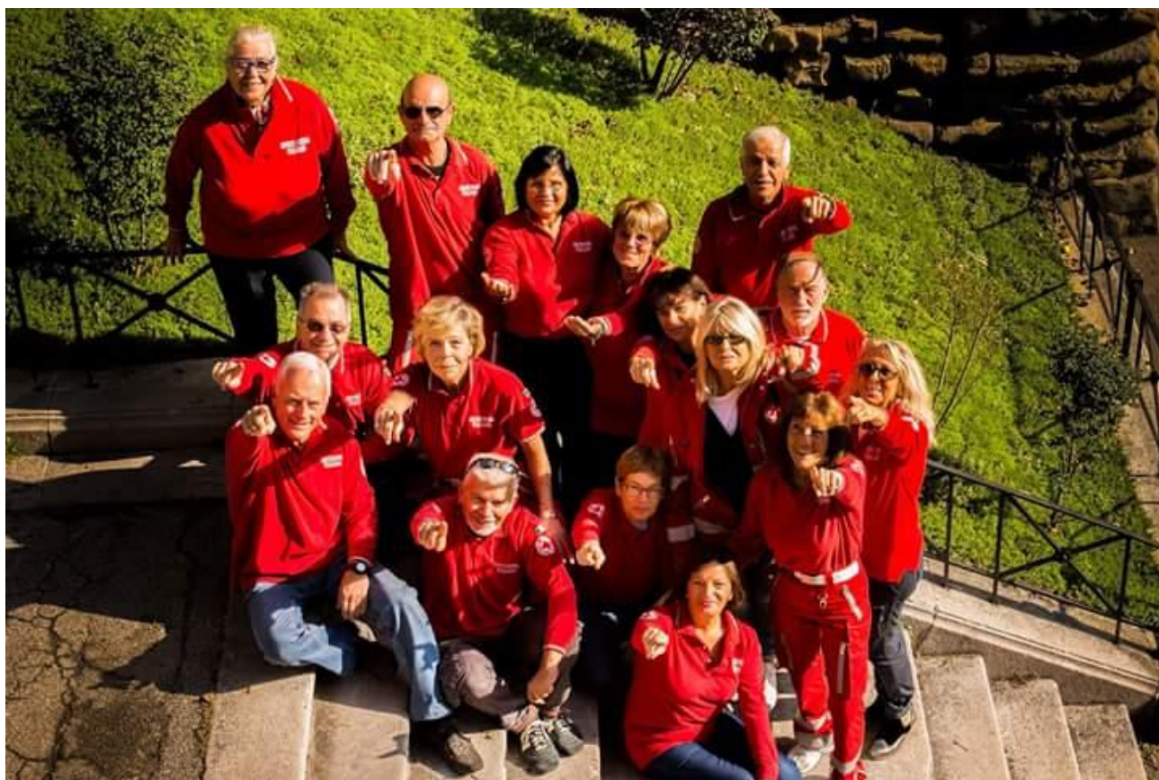
Volontari "Senior" in attività promozionale del reclutamento ottobre 2016